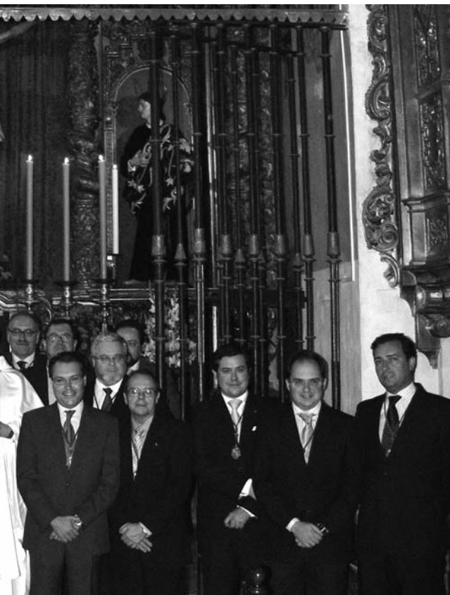
ta, aquí tenemos una instantánea delante de nuestros Sagrados Titulares.

gerencia, cualquier aportación que queráis hacer. Los que ya me conocéis sabéis que soy una persona dialogante, de fácil accesibilidad y con muchas ganas de trabajar.