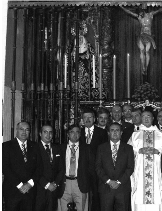
El pasado 3 de noviembre se celebró la toma de posesión de la nueva Junta,

Dentro del rico patrimonio humano con que contamos hay que tener especial dedicación con la juventud, ellos son el presente y el futuro, sin su integración y participación activa la hermandad carece de horizontes. Nuestras hermanas, Capataces y costaleros, nuestros mayores, las familias (tan atacadas en nuestra sociedad) los más necesitados, (mención especial para la Caridad los católicos debemos de ser solidarios y receptivos con el prójimo).... Este es el patrimonio que debemos de cuidar. Todos somos la Hermandad del Calvario.