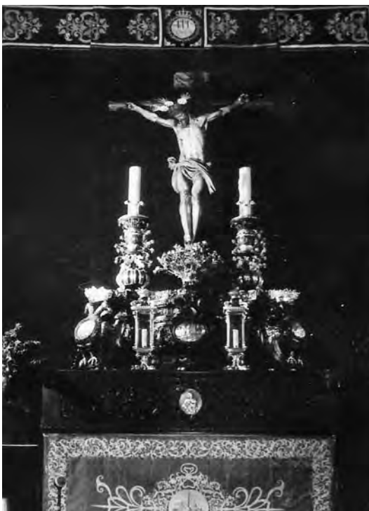
Altar de Quinario de 1967